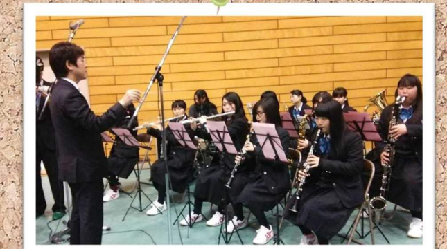
吹奏楽部の演奏で、素晴らしい卒業式になりました。