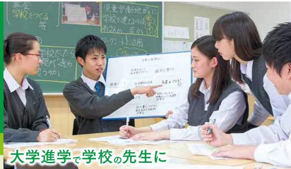
大学進学で学校の先生に