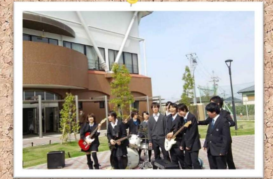
入学式当日、軽音楽部が歓迎の演奏をされていました。