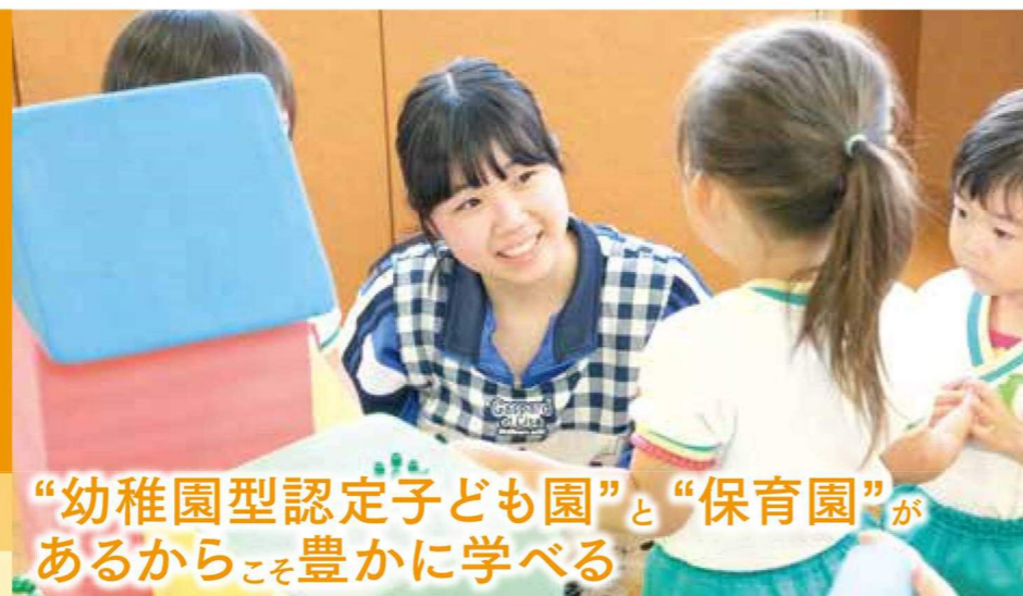
「幼稚園型認定子ども園」と「保育園」があるからこそ豊かに学べる