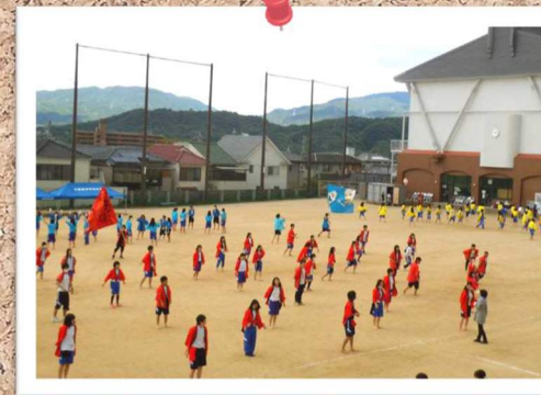
体育大会に向けて、応援団の練習にも熱が入ります。