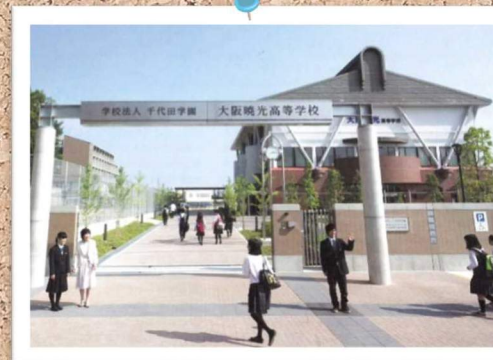
登校時の風景、今日も一日が始まります。