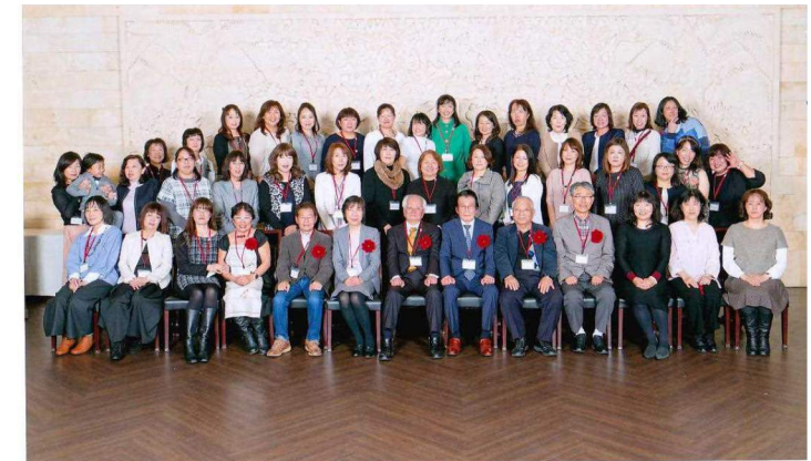
2017年2月25日 千代田高等学校32期生同窓会